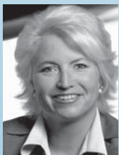
Cornelia Pieper MdB, Stv. Bundesvorsitzende der FDP und Stv. Vorsit- zende des Bildungsaus- schusses des Deutschen Bundestags