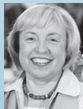
Prof. Dr. Maria Böhmer MdB, Staatsministerin im Bundeskanzleramt und Integrationsbeauftragte der Bundesregierung