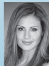
Nazan Eckes, Moderatorin bei RTL